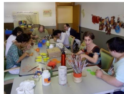
Sala de Expressão Plástica

Porque o tempo passa a correr e não se deve deixar as coisas para a última hora, iniciaram já em Setembro os preparativos para o Natal.